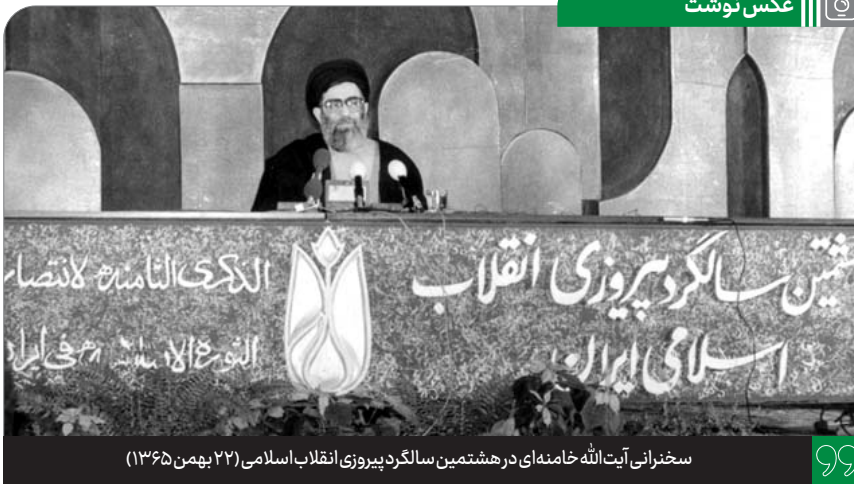
سخنرانی آیت الله خامنه‌ای در هشتمین سالگرد پیروزی انقلاب اسلامی (۲۲ بهمن ۱۳۶۵)