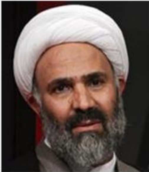
نصرالله پژمانفر گفته: جهانگیری محکومیت مالی و یک سال انفصال خدمت داشته است.

نصرالله پژمانفر گفته: جهانگیری محکومیت مالی و یک سال انفصال خدمت داشته است. وی همچنین گفته: تخلفات لاریجانی را به شورای نگهبان فرستاده‌ام تا بررسی صلاحیتش به آن‌ها رسیدگی شود. اگر لاریجانی اجازه بدهد تخلفاتش را اعلام عمومی می‌کنم تا مردم مطلع شوند.