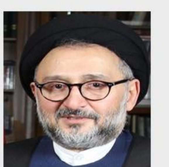
دهد که طرفداران اصلاح طلبان مخالف این هستند که لاریجانی کاندیدای نهایی اصلاح طلبان باشد.

ابطحی معتقد است که به‌خاطر تجربه حمایت از روحانی امکان ارائه یک کاندیدای غیر اصلاح طلب وجود ندارد. او گفته که: من در مجموع، برای لاریجانی پایگاه رأی در جامعه پیدا نکرده‌ام. نتایج نظرسنجی کانال تلگرامی خبرفوری نشان می‌دهد که طرفداران اصلاح طلبان مخالف این هستند که لاریجانی کاندیدای نهایی اصلاح طلبان باشد.