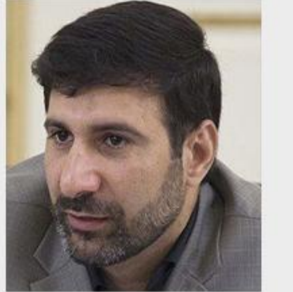
مطلبی از سوی رهبری باشد، به صورت علنی و شفاف اعلام می‌شود.