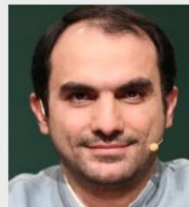
کسانی می‌گویند رأی بی رأی، کسانی که در این سال‌ها رسانه‌های شان تمام قد علیه معیشت مردم و تحریم بیشتر مردم کار کردند.