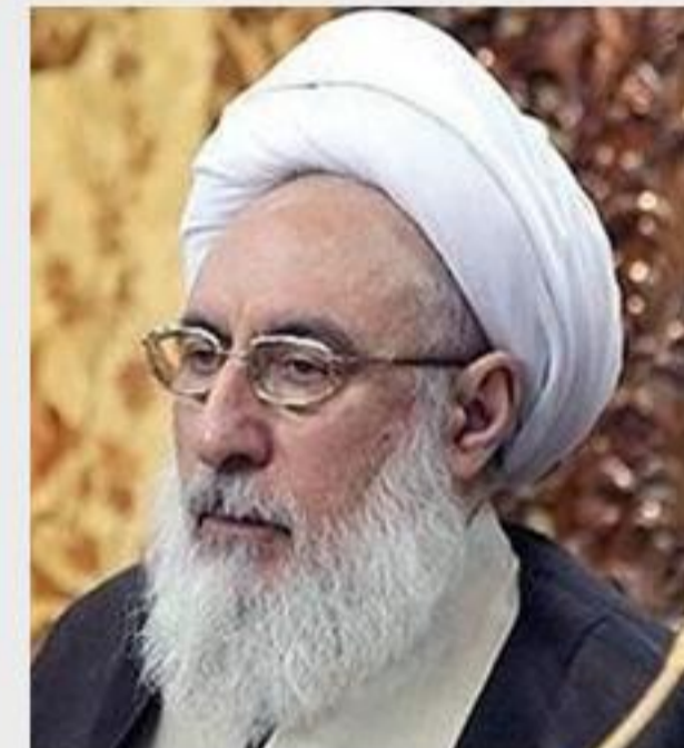
مردم باید فردی از جنس آیت‌الله خامنه‌ای انتخاب کنند.

آیت‌الله مجتهد شبستری با بیان اینکه در روز انتخاب رهبری هم در مجلس خبرگان برخی از این خاطرات مورد استناد قرار گرفت، خاطرنشان کرد: حتی اگر این سخنان هم در مجلس خبرگان بیان نمی‌شد، ما شایسته‌تر از آقای خامنه‌ای برای رهبری نداشتیم؛ اما این چند جمله موجب تسریع در رأی‌گیری شد؛ در این سی و هفت هشت سال هم شایستگی ایشان به کرات اثبات شده است. وی با انتقاد به افزایش دوره‌ای تعداد کاندیداهای ریاست جمهوری اظهار داشت: مردم باید فردی را انتخاب کنند که از جنس آیت‌الله خامنه‌ای و منطبق بر تراز مشخص شده توسط ایشان باشد. باید دقت کنند که چه کسانی در مدت مسئولیت خود موفق عمل کردند و آن را ملاک انتخاب خود قرار دهند.