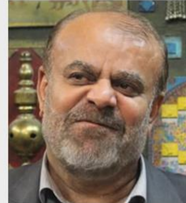
موضوع دیپلماسی و سیاست خارجی اولین اقدامی که باید در دولت سیزدهم، اجرا و محقق بشود.