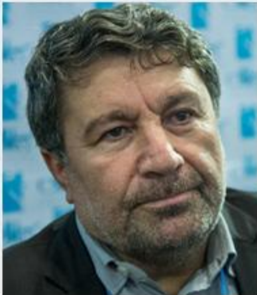
حضرتی دبیرکل حزب اعتماد ملی ریاست ستاد انتخاباتی پزشکیان را بر عهده گرفته است.

حضرتی دبیرکل حزب اعتماد ملی ریاست ستاد انتخاباتی پزشکیان را بر عهده گرفته است. گفته می‌شود که اقبال به پزشکیان توسط اصلاح طلبان افزایش یافته است؛ شنیده‌ها حکایت از این دارد که «مهدی کروبی» نیز بر روی حمایت گسترده حزب اعتماد ملی از وی تأکید کرده است.