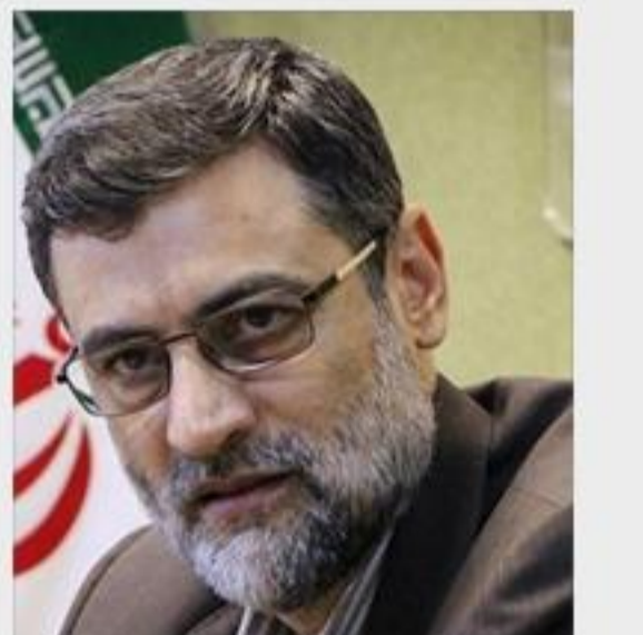
قرعه‌کشی مناظره‌ها برگزار و به شکل زنده و مستقیم پخش خواهد شد.

قاضی زاده هاشمی گفت: تعداد و کم و کیف مناظره‌های انتخاباتی تابع تعداد داوطلبان تأیید صلاحیت شده است. وی همچنین گفت: مناظره‌های انتخاباتی پابرجاست. در فرصت ۴۸ ساعته اعلام نامزدهای تأیید صلاحیت شده تا شروع تبلیغات، قرعه‌کشی مناظره‌ها برگزار و به شکل زنده و مستقیم پخش خواهد شد.