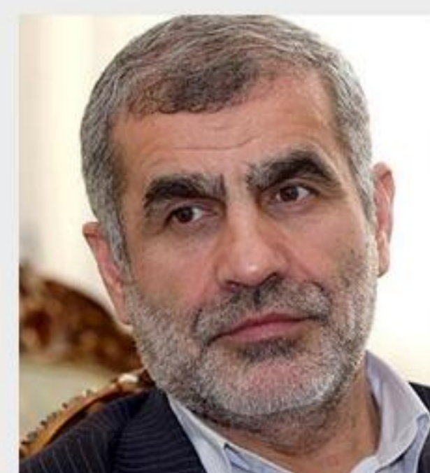
نیکزاد نائب رئیس مجلس با تأکید بر اینکه می‌شود کشور را با تکیه بر جوانان انقلابی و مدیریت جهادی اداره کرد.

نیکزاد نائب رئیس مجلس با تأکید بر اینکه می‌شود کشور را با تکیه بر جوانان انقلابی و مدیریت جهادی اداره کرد، گفت: کسی که گرین کارت دارد نباید در جمهوری اسلامی مسؤول شود، کسی که فرزندانش در آمریکا ساکن شوند و شهروند آمریکا باشند نباید در جمهوری اسلامی مسؤولیت داشته باشند. در ۴۲ سال اخیر مسئولانی که بر سر کار آمدن عهد بستند که به آرمان‌های انقلاب اسلامی پایبند باشند اما در واقع برخی از آن‌ها پایبند نبودند که منجر به شکل‌گیری دو جریان فکری در کشور شد. وی افزود: گروه اول همواره تلاش کرده‌اند تا با تکیه بر توان داخلی بر مشکلات فائق شوند در حالی که گروه دوم معتقدند که به بن‌بست رسیدیم و باید در اقتصاد جهان ادغام شویم و جهان ما را بپذیرد و با تجارت آزاد با جهان به توسعه و رفاه برسیم.