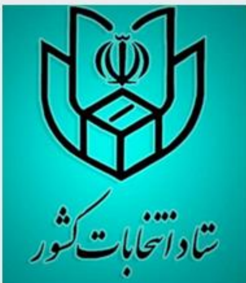
کمیته اطلاع رسانی ستاد انتخابات کشور، دستورالعمل بهداشتی انتخابات ۲۸ خرداد ۱۴۰۰ را که پس از تصویب در ستاد ملی کرونا از سوی رئیس جمهوری ابلاغ شده است، در ۱۵ بند منتشر کرد.