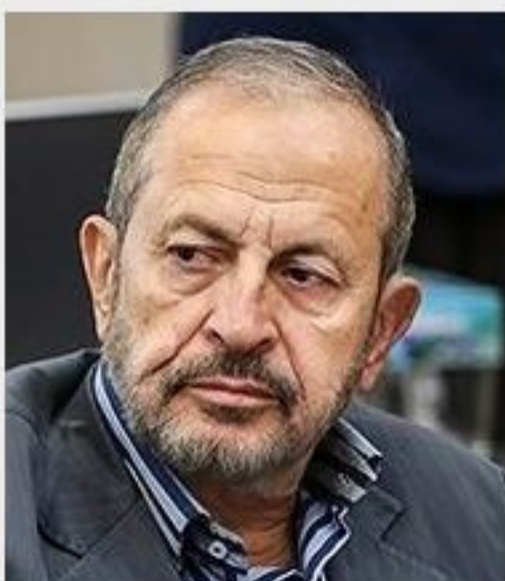
علیرضا افشار داوطلب انتخابات ریاست جمهوری پس از دیدار امروز با آیت‌الله سید ابراهیم رئیسی و تقدیم ۵۰ برنامه ملی و تحول‌آفرین به رهبر معظم انقلاب و دولت انقلابی آینده، طی صدور بیانیه‌ای-با حمایت از آیت‌الله رئیسی از انتخابات ریاست جمهوری کنارگیری کرد.