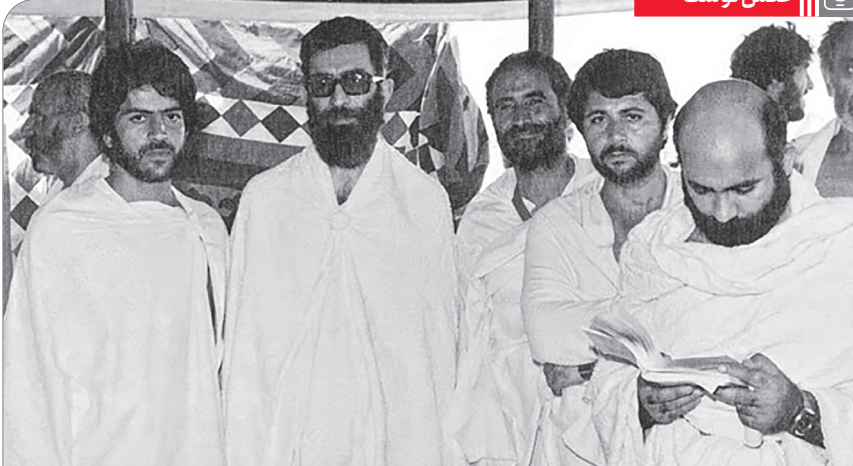
تصویری از سفر حج آیت الله خامنه‌ای در سال ۱۳۵۸