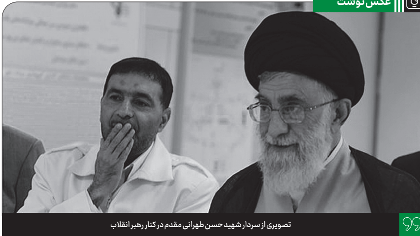
تصویری از سردار شهید حسن طهرانی مقدم در کنار رهبر انقلاب