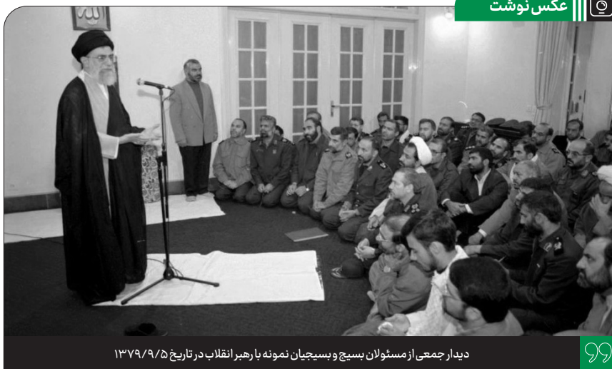
دیدار جمعی از مسئولان بسیج و بسیجیان نمونه با رهبر انقلاب در تاریخ ۱۳۷۹/۹/۵

پنجم جمادی الاولی، میلاد حضرت زینب کبری عظیمت و روزپرستار مبارک