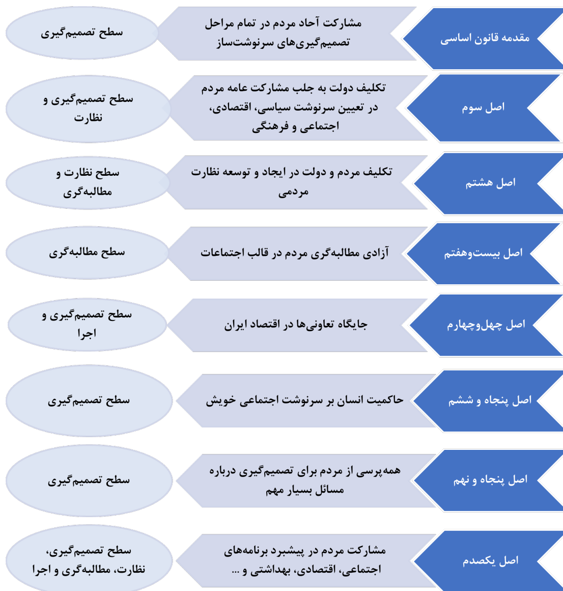
شکل ۱. جایگاه مشارکت اجتماعی در قانون اساسی [۱]

پس از پیروزی انقلاب اسلامی نیز قانون اساسی کشور با حمایت اکثریت قریب به اتفاق جامعه تدوین شد که مآل‌مال از مسئولیت‌دهی به آحاد مردم بود و این نقش در تصمیم‌گیری، نظارت، مطالبه‌گری و اجرا منحصر به فرد است. مدل زیر مهم‌ترین بخش‌های مردم‌سالاری در قانون اساسی را نشان می‌دهد: